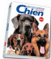
Royal Canin Kutyaenciklopédia